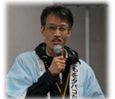
NHK「ためしてガッテン」 にもご出演

動機づけ面接トレーナー 予防医療 研究所代表、トヨタ記念病院禁煙外 来、トヨタ自動車診療所医師